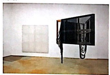
韓國編織藝術家Seungean Chaf的《One thing-2》。