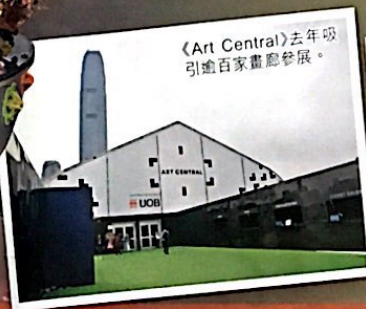
《Art Central》去年吸引逾百家畫廊參展。