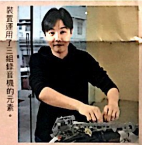
裝置運用了三組錄音機的元素。