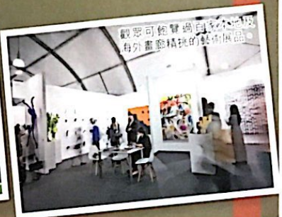
觀眾可飽覽過百家本地及海外畫廊精挑的藝術展品。