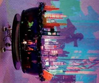
繽紛幻變的作品，反映時代變遷。